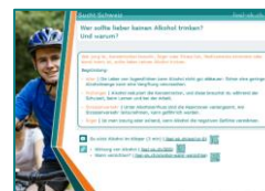
Rückseite Für Jugendliche

Vorschläge, wie Sie die Themen von Abenteuerinsel mit Jugendlichen behandeln können, erfahren Sie auf feel-ok.ch/ai