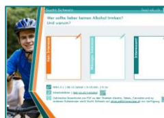
Vorderseite Für Erwachsene

Die Rückseite bietet eine Antwort an, die erst nach der Diskussion vorgelesen wird.